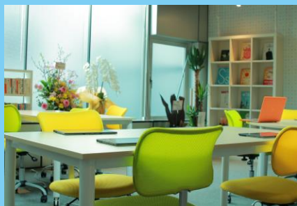
<SmartSchool麻布本校> 東京都港区西麻布3-22-10 Students' Ark