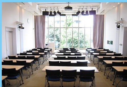
<霞が関ナレッジスクエア> 東京都千代田区霞が関3-2-1