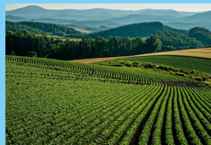
<フィールドワーク> 群馬の農場 及び 都内の大学キャンパス